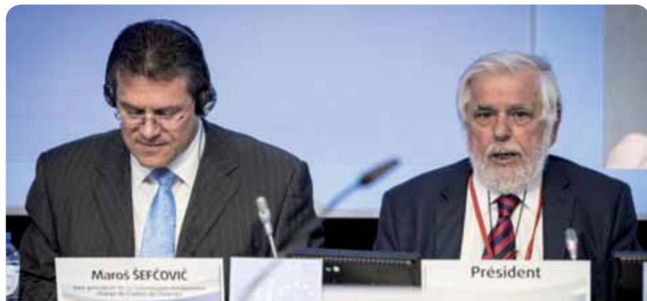
Euroopa Komisjoni asepresident Maroš Šefčovič ja EMSK president Georges Dassis