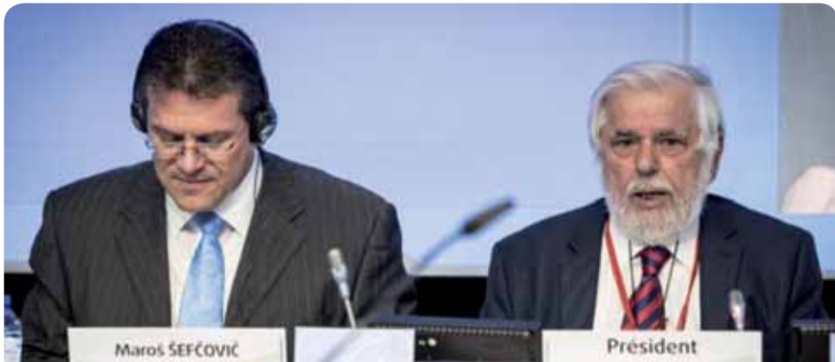
Maroš Šefčovič, vicepresidente de la Comisión, y Georges Dassis, presidente del CESE

El dictamen del CESE sobre el estado de la Unión de la Energía 2015 (ponente: Stéphane Buffetaut, Grupo de Empresarios) aprobado en el pleno de abril del CESE pide que se haga mayor hincapié en la dimensión social de la Unión de la Energía e insta a la Comisión a incluir este aspecto entre los criterios de evaluación del próximo informe anual.