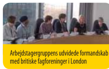
Arbejdsgivergruppens udvidede formandskab med britiske fagforeninger i London

Deltagerne fremhævede den virkelige gode timing af den undersøgelse, som Labours analyseafdeling efter anmodning fra Arbejdsgivergruppen har foretaget og offentliggjort, netop som den britiske regering fremlagde et lovforslag, der lægger op til de mest radikale indgreb i fagforeningsrettigheder i 30 år. I undersøgelsen »The crisis and the Evolution of Labour Relations in the UK«, som kan findes på: http://www.eesc.europa.eu/?i=portal.en.group-2-studies.39081 , redegøres der for de enkelte elementer i lovforslaget, og det konkluderes bl.a., at adskillige af de foranstaltninger, som den konservativt ledede regering har truffet, har forrykket styrkeforholdet vedrørende en række forhold på arbejdspladserne i retning af arbejdsgiverne. Deltagerne var derfor af den opfattelse, at de britiske arbejdsgivere vil være bedre stillet i EU, hvor EU-retten på det sociale og arbejdsmarkedsmæssige område