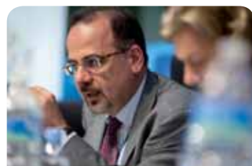
Předseda skupiny Různé zájmy Luca Jahier

Akce bude rovněž příležitostí poprvé představit stejnojmennou studii, kterou EHSV zadal u organizací Culture Action Europe a United Cities and Local Government (UCLG – Agenda 21).