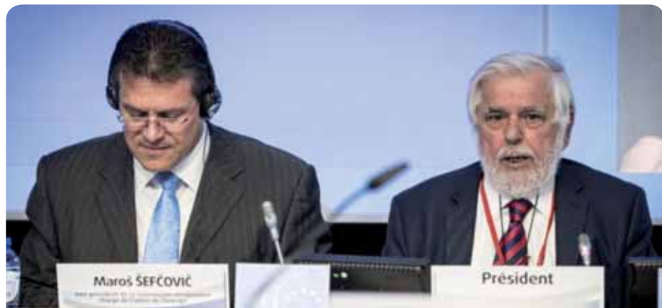
Заместник-председателят на Европейската комисия Марош Шевчович и председателят на ЕИСК Жорж Дасис