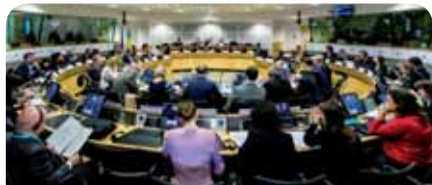
ES un Ukrainas pilsoniskās sabiedrības platformas (CSP) otrā sanāksme

"Tas iezīmē jaunu posmu abu pušu pilsoniskās sabiedrības institucionālajā sadarbībā," uzsvēra