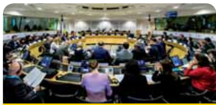
2-asis ES ir Ukrainos pilietinės visuomenės platformos (PVP) posėdis

„Tai mūsų pilietinių visuomenių institucinio bendradarbiavimo naujo etapo