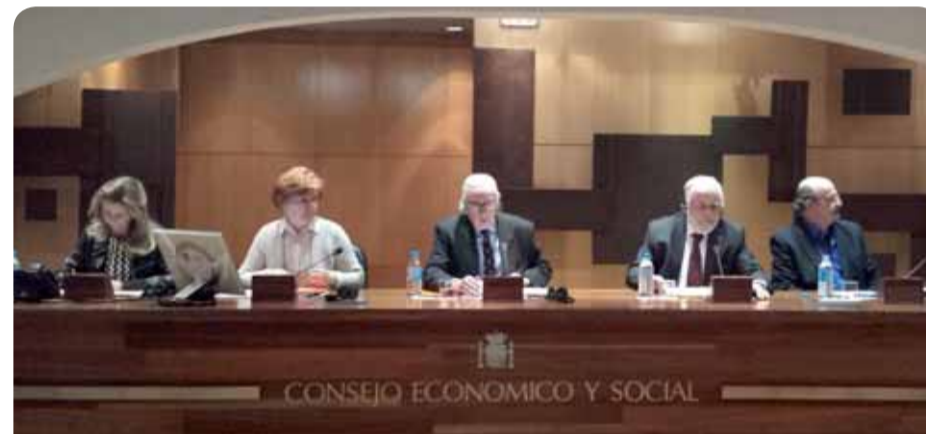
Predsjednik Georges Dassis u Španjolskom gospodarskom i socijalnom vijeću

Predsjednik EGSO-a Georges Dassis u veljači je bio u tri službena posjeta: Grčkoj, Nizozemskoj i Španjolskoj. U utorak, 9. veljače susreo se s predsjednikom Helenske Republike Prokopiosom Pavlopoulosom. G. Pavlopoulos izjavio je da EGSO ima posebnu i povijesnu ulogu te poručio da je Odbor „osnovan kao osvjedočenje društvenog aspekta Europske unije i da predstavlja temeljni stup cijelog europskog projekta“. Izrazio je i zadovoljstvo činjenicom da se na čelu EGSO-a ponovo nalazi Grk. G. Dassis zahvalio je grčkom predsjedniku i napomenuo da EGSO usvaja mišljenja uz podršku velike većine članova. Također je naglasio da stroge mjere štednje nisu rješenje za gospodarsku krizu. Osvrnuo se posebno na inicijative koje je EGSO poduzeo kao odgovor na krizu, među kojima su mišljenja o porezu na financijske transakcije i dijeljenju tereta javnog duga u zemljama koje se nađu u problemima, uključujući Grčku. Također je iznio stav Odbora o izbjegličkoj i migracijskoj krizi te opisao sve mjere koje je EGSO poduzeo, uključujući misije u 12 zemalja u okviru programa „Djelujemo lokalno“.