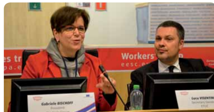
Gabriele Bischoff, predsjednica Skupine radnika, i Luca Visentini, glavni tajnik ETUC-a

Vodila se rasprava i o zajedničkim prioritetima Skupine radnika i sindikalnog pokreta tijekom koje je Luca Visentini, glavni tajnik ETUC-a, insistirao na tome da je Schengen najveći prioritet s obzirom na to da je schengenska pravna stečevina ugrožena zbog izbjegličke krize i pregovora s Ujedinjenom Kraljevinom. Dodao je da je među prioritetima i borba protiv nastojanja da se u kontekstu pregovora o Brexitu srežu socijalna prava i uništi europski socijalni model. Naglasio je i da se radnički pokret mora mobilizirati kako bi spriječio pokušaje da se ukinu stečena prava, kao što je pravo na štrajk, koje se napada u nekoliko zemalja. (mg) ●