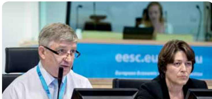
Jacek Krawczyk, predsjednik Skupine poslodavaca, i Violeta Bulc, povjerenica EU-a za promet, na prošlom javnom savjetovanju o zrakoplovnoj strategiji EU-a

U sklopu tog procesa 21. travnja će se u EGSO-u održati javno savjetovanje o zrakoplovnoj strategiji EU-a.