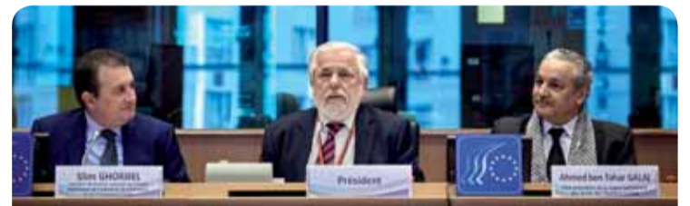
Georges Dassis, președintele CESE, alături de Slim Ghorbel, membru al Comitetului executiv al Uniunii tunisiene a industriei, comerțului și artizanatului (UTICA) și Ahmed ben Tahar Galai, vicepreședintele Ligii tunisiene pentru apărarea drepturilor omului (LTDH), la sesiunea plenară a CESE

Președintele CESE, dl Georges Dassis , a declarat că „noi, reprezentanții societății civile europene, nu numai că dorim să omagiem astăzi succesul dumneavoastră într-o regiune care traversează o perioadă dificilă, ci să ne și inspirăm din realizările dumneavoastră pentru propriile noastre eforturi și să vă sprijinim în activitățile în curs și viitoare, așa cum trebuie să îi sprijinim pe toți actorii societății civile din alte țări din regiune, angajați