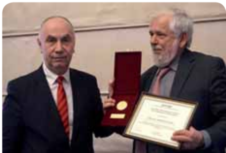
Georges Dassis EGSZB-elnök és prof. Lalko Dulevski, a Bolgár Gazdasági és Szociális Tanács elnöke

Január 14-én Georges Dassis, az Európai Gazdasági és Szociális Bizottság (EGSZB) elnöke megkezdte kétnapos látogatását Bulgáriában. Mióta 2015. októberben megválasztották az EGSZB elnökévé, ez volt az első olyan hivatalos látogatása, amellyel eleget tett egy uniós tagállam nemzeti gazdasági és szociális tanácsa felkérésének.