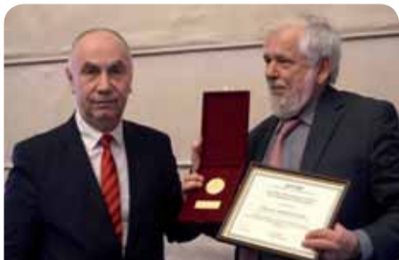
ο κ. Γιώργος Ντάσης, Πρόεδρος της ΕΟΚΕ, με τον καθ. Lalko Dulevski, Πρόεδρο της εθνικής Οικονομικής και Κοινωνικής Επιτροπής της Βουλγαρίας

Στις 14 Ιανουαρίου, ο Πρόεδρος της Ευρωπαϊκής Οικονομικής και Κοινωνικής Επιτροπής (ΕΟΚΕ), Γιώργος Ντάσης, ξεκίνησε τη διήμερη επίσκεψή του στη Βουλγαρία. Πρόκειται για την πρώτη επίσημη επίσκεψη που πραγματοποιήθηκε ανταποκρινόμενος σε πρόσκληση εθνικής Οικονομικής και Κοινωνικής Επιτροπής κράτους μέλους της ΕΕ από την εκλογή του ως Προέδρου της ΕΟΚΕ τον Οκτώβριο 2015.