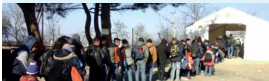
EESK:s delegation till Grekland – Flyktingmottagningen i Eidomeni

”Att få ta emot priset kommer avsevärt att stärka Barkas roll i utvecklingen av den sociala ekonomin internationellt. Barka-stiftelsen har nyligen kontaktats av icke-statliga organisationer och institutioner i f.d. jugoslaviska republiken Makedonien och Serbien som är intresserade av att använda det polska systemet för att skapa lokala partnerskap, social integration och socialt företagande i sina lokalsamhällen. Barka har också arbetat med den afrikanska diasporan i Europa liksom med lokalsamhällen i Kenya och Etiopien.” (sg) ●