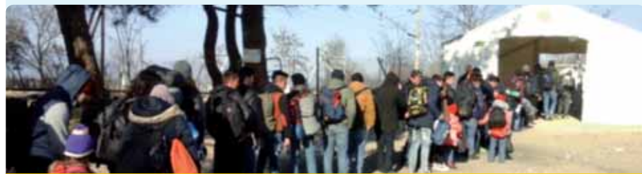
Misija EESO v Grčiji – Krizni sprejemni center v Eidomeniju

„Nagrada bo močno okrepila vlogo fundacije za vzajemno pomoč Barka pri mednarodnem razvoju socialnega gospodarstva. Z njo so nedavno navezale stik nevladne organizacije in ustanove iz Makedonije in Srbije, ki bi rade v svojih skupnostih uporabile poljski sistem ustvarjanja lokalnih partnerstev, centrov za vključevanje v družbo in socialnih podjetij. Barka sodeluje tudi z afriškimi izseljenci v Evropi ter lokalnimi skupnostmi v Keniji in Etiopiji.“ (sg)