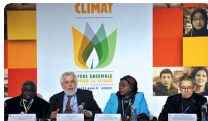
Predseda EHSV Georges Dassis s účastníkmi panelovej diskusie na parížskej konferencii o klíme 2015 (COP 21)

V mnohých spoločenstvách v celej Európe i mimo nej už občania a organizácie občianskej spoločnosti presadzujú udržateľné zmeny. Zohrávajú kľúčovú úlohu pri zintenzívňovaní činnosti a urýchľovaní prechodu na nízkouhlíkové