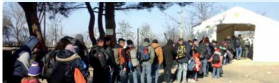
Delegacja EKES-u do Grecji – awaryjny punkt szybkiej rejestracji imigrantów w Idomeni

Wynik głosowania: 152 głosów za, 6 przeciw, 13 osób wstrzymało się od głosu.