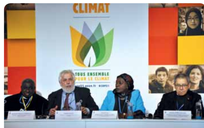
Georges Dassis, voorzitter van het EESC, met de deelnemers aan de klimaatconferentie van 2015 in Parijs (COP21)

In heel Europa, maar ook daarbuiten, zijn de burgers en het maatschappelijk middenveld al de drijvende kracht achter duurzame verandering. Zij spelen een cruciale rol in het aanzetten tot maatregelen en het versnellen van de overgang naar een koolstofarme economie. Hun rol en betrokkenheid zullen absoluut essentieel zijn voor de uitvoering van de besluiten die in Parijs zijn genomen.