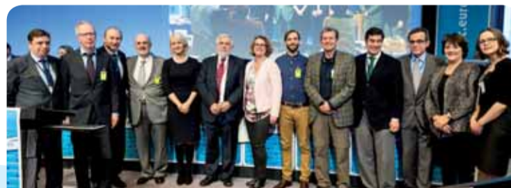
De vijf winnende organisaties tijdens de zitting van het EESC

De vijf winnende initiatieven geven een kleine indruk van de inspanningen die duizenden vrijwilligersorganisaties en ngo's in heel Europa jaarlijks verrichten. Elk van de projecten heeft – elk op zijn eigen wijze – betrekking op het thema van 2015: armoedebestrijding. De Duitse en de Finse initiatieven zijn