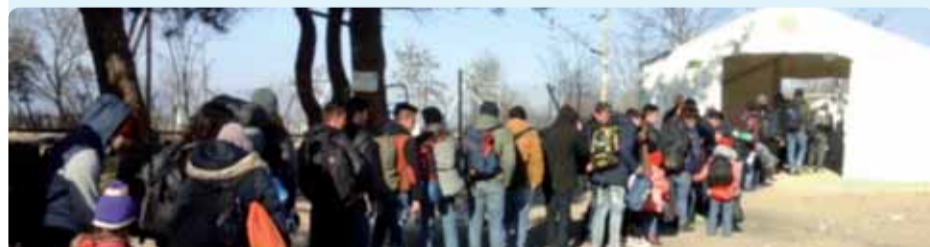
Bezoek EESC-delegatie aan Griekenland – centrum voor noodopvang in Eidomeni

Stemuitslag: goedgekeurd met 152 stemmen vóór en 6 stemmen tegen, bij 13 onthoudingen.