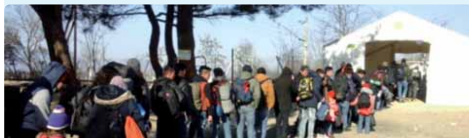
Il-missjoni tal-KESE fil-Greċja – Ċentru ta' akkoljenza ta' emerġenza f'Eidomeni

„Il-premju ser isaħħaħ b'mod sinifikanti r-rwol ta' Barka fl-iżvilupp soċjali fil-livell internazzjonali. Reċentement il-Barka Foundation kienet avvicianta minn NGOs u istituzzjonijiet mill-Maċedonja u s-Serbja li huma interessati li jwaqqfu sistema identika għal dik fil-Polonja biex jinholqu sħubijiet lokali, ċentri ta' integrazzjoni soċjali u intrapriżi soċjali fil-komunitajiet tagħhom. Barka qed taħdem ukoll mad-dijaspora Afrikana fl-Ewropa kif ukoll ma' komunitajiet lokali fil-Kenja u fl-Etjopja.“ (sg)