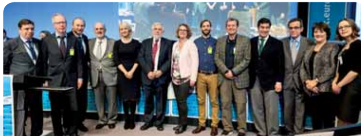
Il-hames organizzazzjonijiet rebbieħa waqt is-sessjoni plenarja tal-KESE

Il-hames inizjattivi rebbieħa jipprovdu stampa cara tal-hidma li qed issir minn eluf ta' gruppi volontarji u NGOs madwar l-Ewropa. Kull proġett jindirizza t-tema għall-2015 tal-faqar bil-mod partikolari tiegħu. L-inizjattiva Germaniża u dik Finlandiża ngħataw EUR 11 500 kull