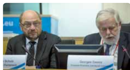
Eiropas Parlamenta priekšsēdētājs Martin Schulz un EESK priekšsēdētājs Georges Dassis konferencē par TTIP

EESK atbalsta konstruktīvu dialogu ar sociālajiem partneriem