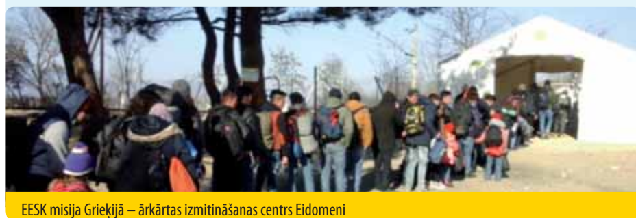
EESK misija Grieķijā – ārkārtas izmitināšanas centrs Eidomeni

Balsojuma rezultāts: pieņemts ar 152 balsīm par, 6 balsīm pret un 13 atturoties. ●