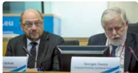
Europos Parlamento Pirmininkas Martin Schulz su EESRK pirmininku Georges Dassis konferencijoje dėl TPIP

Lapkričio mėn. Europos ekonomikos ir socialinių reikalų komitetas (EESRK) pakvietė Europos socialinius partnerius aptarti Transatlantinę prekybos ir investicijų partnerystės susitarimą (TPIP), dėl kurio šiuo metu vyksta Europos ir Jungtinių Amerikos Valstijų derybos. Renginyje dalyvavo už prekybą atsakinga ES Komisijos narė Cecilia Malmström, Europos Parlamento Pirmininkas Martin Schulz, Liuksemburgo Ministras Pirmininkas Xavier Bettel, EESRK pirmininkas Georges Dassis ir kiti atstovai. Po to vyko diskusijos, per kurias paaiškėjo, kad į daug klausimų dar lieka neatsakyta. Dalyviai paragino siekti skaidrių derybų, teikti išsamią informaciją, kuri aiškiai parodytų TPIP pranašumus ir trūkumus, ir aktyviau įtraukti socialinius partnerius.