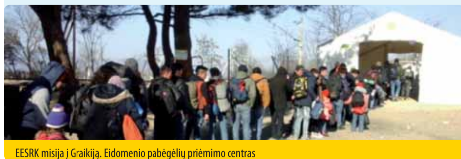
EESRK misija į Graikiją. Eidomenio pabėgėlių priėmimo centras

Balsavimo rezultatai: nuomonė priimta 152 nariams balsavus už, 6 – prieš ir 13 susilaikius. ●