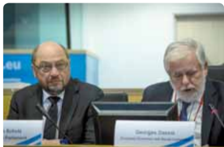
Predsjednik Europskog parlamenta Martin Schulz i predsjednik EGSO-a Georges Dassis na konferenciji o TTIP-u

Europski gospodarski i socijalni odbor (EGSO) pozvao je u studenom 2015. europske socijalne partnere na raspravu o Transatlantskom partnerstvu za trgovinu i ulaganja (TTIP) – o kojem se upravo vode pregovori između Sjedinjenih Država i Europe – s povjerenicom EU-a za trgovinu Cecilijom Malmström, predsjednikom Europskog parlamenta Martinom Schulzom, premijerom Luksemburga Xavierom Bettelom, predsjednikom EGSO-a Georgesom Dassisom i drugim predstavnicima. Rasprava je pokazala da na mnoga pitanja i dalje nema odgovora. Sudionici su pozvali na transparentne pregovore, sveobuhvatne informacije – koje jasno pokazuju prednosti i nedostatke TTIP-a – te veću uključivost socijalnih partnera.