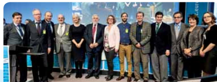
Pet nagrađenih organizacija na plenarnom zasjedanju EGSO-a

Pet pobjedničkih inicijativa primjer su rada koji obavljaju tisuće volonterskih skupina i nevladinih organizacija diljem Europe. Tema natječaja 2015. godine bilo je siromaštvo, a svaki se projekt njome bavio na vlastiti način. Njemačkoj i finskoj inicijativi