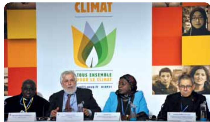
Predsjednik EGSO-a Georges Dassis s panelistima na pariškoj konferenciji o klimi (COP21)

U mnogim zajednicama diljem Europe i šire građani i organizacije civilnog društva već su pokretači održivih promjena. Imaju ključnu ulogu u intenziviranju djelovanja i ubrzanju prijelaza na niskougljično gospodarstvo. Njihova uloga i uključenost bit će bez sumnje presudni za provedbu odluka donesenih u Parizu.