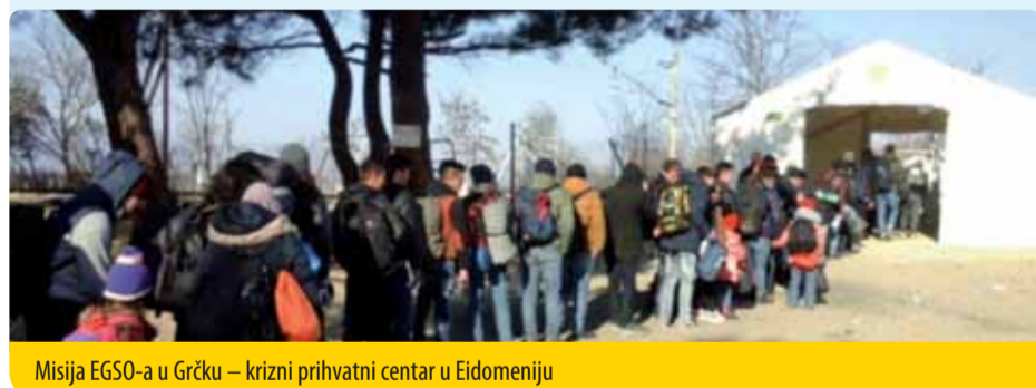
Misija EGSO-a u Grčku – krizni prihvatni centar u Eidomeniju

Rezultat glasovanja: usvojeno sa 152 glasa za, 6 protiv i 13 suzdržanih.