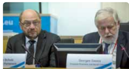
Euroopan parlamentin puhemies Martin Schulz yhdessä ETSK:n puheenjohtajan Georges Dassinin kanssa transatlanttista kauppaa- ja investointisopimusta käsittelevässä konferenssissa

Euroopan talous- ja sosiaalikomitea (ETSK) kutsui marraskuussa 2015 eurooppalaisten työmarkkinaosapuolten edustajat keskustelemaan transatlanttisesta kauppaa- ja investointikumppanuudesta (TTIP), josta Yhdysvallat ja EU parhaillaan neuvottelevat. Keskusteluun osallistuivat myös kaupapolitiikasta vastaava komission jäsen Cecilia Malmström, Euroopan parlamentin puhemies Martin Schulz, Luxemburgin pääministeri Xavier Bettel, ETSK:n puheenjohtaja Georges Dassis sekä muita edustajia. Käydyissä keskusteluissa ilmeni, että monet kysymykset jäävät edelleen vailla vastausta. Osanottajat vaativat avoimia neuvotteluja ja kattavia tietoja, joista ilmenevät selkeästi TTIP:n edut ja haitat, sekä työmarkkinaosapuolten nykyistä laajempaa osallistumista.