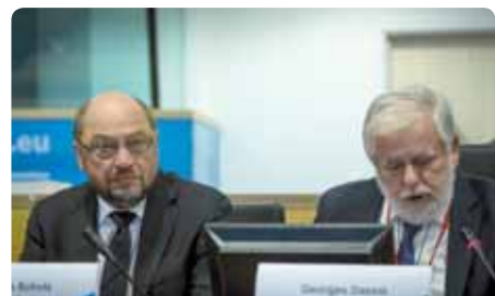
Euroopa Parlamendi president Marin Schulz koos EMSK presidendi Georges Dassisega TTIP-teemalisel konverentsil

Euroopa Majandus- ja Sotsiaalkomitee kaitseb konstruktiivset dialoogi sotsiaalpartneritega