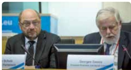
Martin Schulz, presidente del Parlamento Europeo, y Georges Dassis, presidente del CESE, durante la conferencia sobre la ATCI

El CESE aboga por el diálogo constructivo con los interlocutores sociales