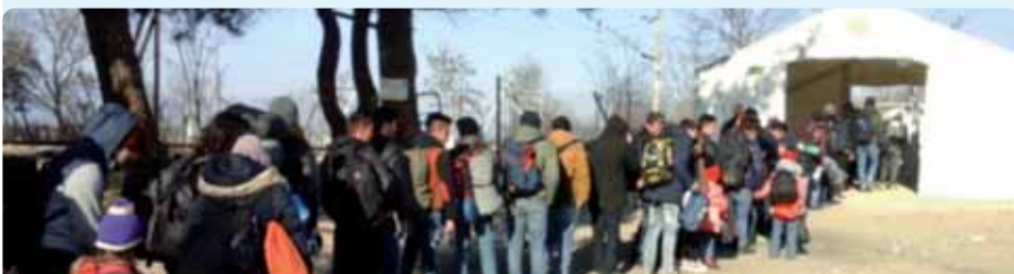
EØSU på besøg i Grækenland – Nødmottagelsescentre i Eidomeni

Afstemning: vedtaget med 152 stemmer for, 6 imod og 13 hverken for eller imod ●