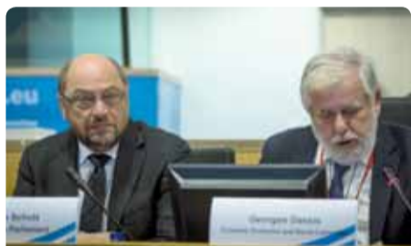
Europa-Parlamentets formand Martin Schulz med EØSU's formand Georges Dassis på TTIP-konferencen

EØSU sætter skub i den konstruktive dialog med arbejdsmarkedets parter