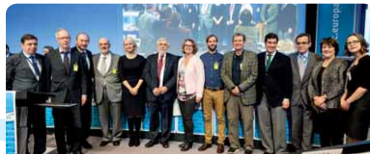
Pět oceněných organizací na plenárním zasedání EHSV

Pět oceněných iniciativ je názornou ukázkou toho, jakou činnost odvádějí tisíce dobrovolných uskupení a nevládních organizací po celé Evropě. Každý z těchto projektů přistupuje k tématu chudoby, na