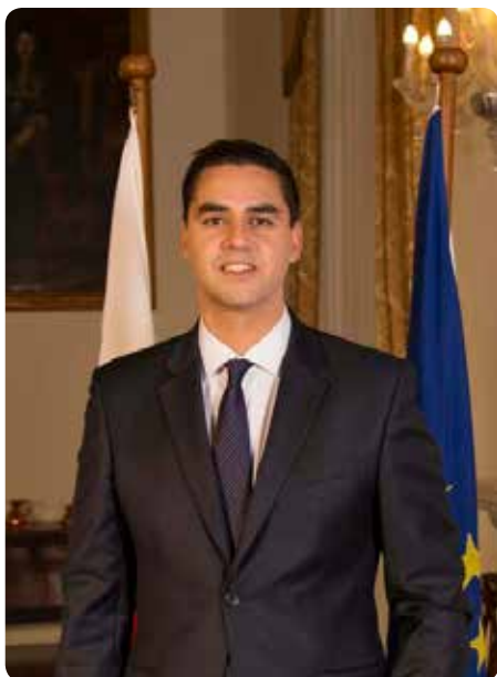
Dr Ian BORG Segretarju Parlamentari għall-Presidenza tal-UE 2017 u għall-Fondi tal-UE

Il-Presidenza b'rotazzjoni tal-Kunsill tal-UE tagħti opportunità politika, ekonomika u kulturali unika lil Malta. Peress li din inzerat fi żmien ta' sfidi li qatt ma esperjenzajna b'halhom qabel, hija toffri opportunità eċċellenti biex il-kuraġġ politiku, it-tmexxija b'saħħitha u l-vuċi indipendenti u ċara ta' Malta jkunu strumentali biex jgħaqqdu aktar lill-Unjoni għall-gid komuni taċ-ċittadini Ewropej.