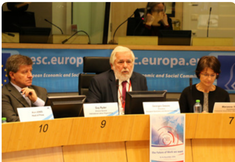
De gauche à droite: le directeur général de l'OIT, Guy Ryder, le président du CESE, Georges Dassis, et la commissaire européenne Marianne Thyssen à la conférence de presse sur l'avenir du travail

Les 15 et 16 novembre 2016, le CESE et l'Organisation internationale du travail (OIT) ont tenu un débat de haut niveau à Bruxelles sur l' avenir du travail . Celui-ci a rassemblé plus de 300 représentants des partenaires sociaux et de la société civile. M. Georges Dassis, président du CESE, M. Guy Ryder, le directeur général de l'OIT nouvellement réélu, et la commissaire européenne Marianne Thyssen ont pris la parole lors de la session d'ouverture.