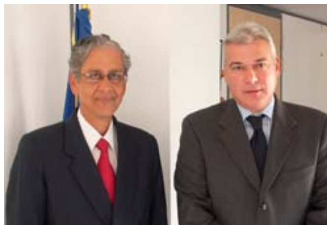
De heer Dimitris Dimitriadis, voorzitter van het Europees Economisch en Sociaal Comité, en de heer Dipak Chatterjee, ambassadeur van India in België en Luxemburg (van rechts naar links)

39. Wij moeten onze banden met het Chinese maatschappelijk middenveld versterken door in het eerste halfjaar van 2007 een eerste bijeenkomst te organiseren naar het voorbeeld van het rondetafeloverleg met India. Wij moeten er samen met onze Chinese partners naar streven om de Chinese overheid over te halen de internationale handels- en mededingingsregels na te leven en goede praktijkvoorbeelden op sociaal- en milieugebied na te volgen.