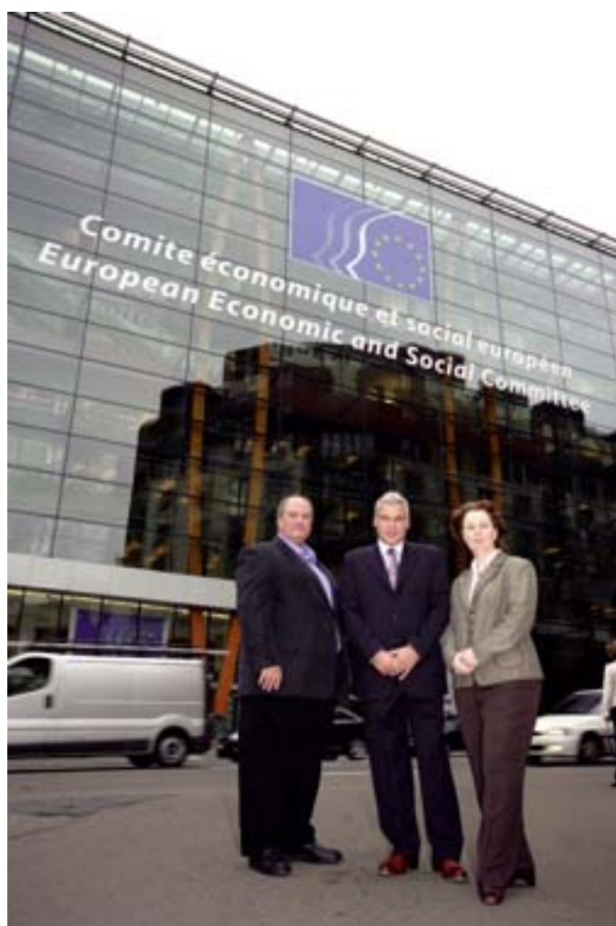
© Architectes: ART & BUILD + atelier d'architecture Paul NOËL Photo: isopixE, Ansoie