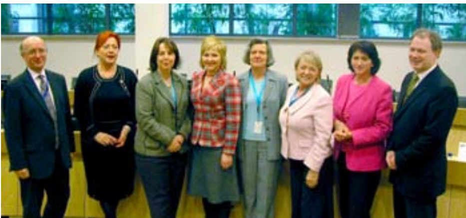
Vergadering van de groep Communicatie op 1 februari 2007