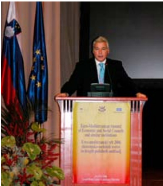
De heer Dimitris Dimitriadis, voorzitter van het Europees Economisch en Sociaal Comité, tijdens de Euromed-top op 16 november 2006 in Slovenië