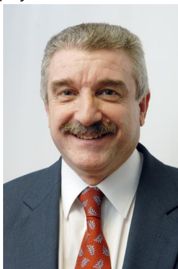
Miguel Ángel Cabra de Luna

Κατά τη διάρκεια των τελευταίων ετών, έχουν σημειωθεί σημαντικές βελτιώσεις στον τομέα, όσον αφορά την πολιτική και νομική αναγνώριση, τόσο σε επίπεδο ΕΕ (Πράξη για την ενιαία αγορά, πρωτοβουλία για την κοινωνική επιχειρηματικότητα, θεσμικό πλαίσιο του ευρωπαϊκού ιδρύματος, ταμεία κοινωνικής επιχειρηματικότητας, κ.λπ.) όσο και σε εθνικό επίπεδο (π.χ. ο προσφάτως εγκριθείς ισπανικός νόμος για την κοινωνική οικονομία). Ευελπιστώ ότι η παρούσα μελέτη θα συνεισφέρει θετικά στην προώθηση της αναγνώρισης της κοινωνικής οικονομίας.