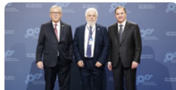
Predseda EK Jean-Claude Juncker , predseda EHSV Georges Dassis a švédsky premiér Stefan Löfven na sociálnom summite pre spravodlivé pracovné miesta a rast 2017

Led by its President Georges Dassis , a delegation of EESC members took part in the high-level social summit in Gothenburg on 17 November where the European Pillar of Social Rights (EPSR) was jointly proclaimed by the European Commission, the Council and the European Parliament. In a show of support for the EPSR, the EESC has repeatedly warned in its opinions that without social rights, backed by a sound and sustainable economic basis, the future of the EU will be at stake. (II)