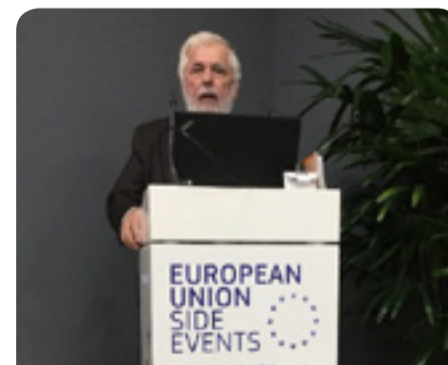
Жорж Дасис , председател на ЕИСК, по време на съпътстващата проява в рамките на 23-тата конференция на страните по РКООНИК

С оглед на смекчаването на въздействието от изменението на климата е необходимо да се предоставят устойчиви алтернативи на потребителите, което не означава по-лошо качество или по-високи цени. ЕИСК насърчава също и премахването на субсидиите за изкопаемите горива.