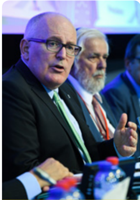
Франс Тимерманс, първи заместник-председател на ЕК и Жорж Дасис, председател на ЕИСК, на пленарната сесия

Габриеле Бишоф , председател на група „Работници“, приветства факта, че Комисията е наблегнала върху социалния стълб. Яцек Кравчик , председател на група „Работодатели“, изтъкна необходимостта от насочване на вниманието към области, в които действията на ЕС имат добавена