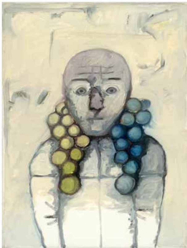
Grapes - Raisins