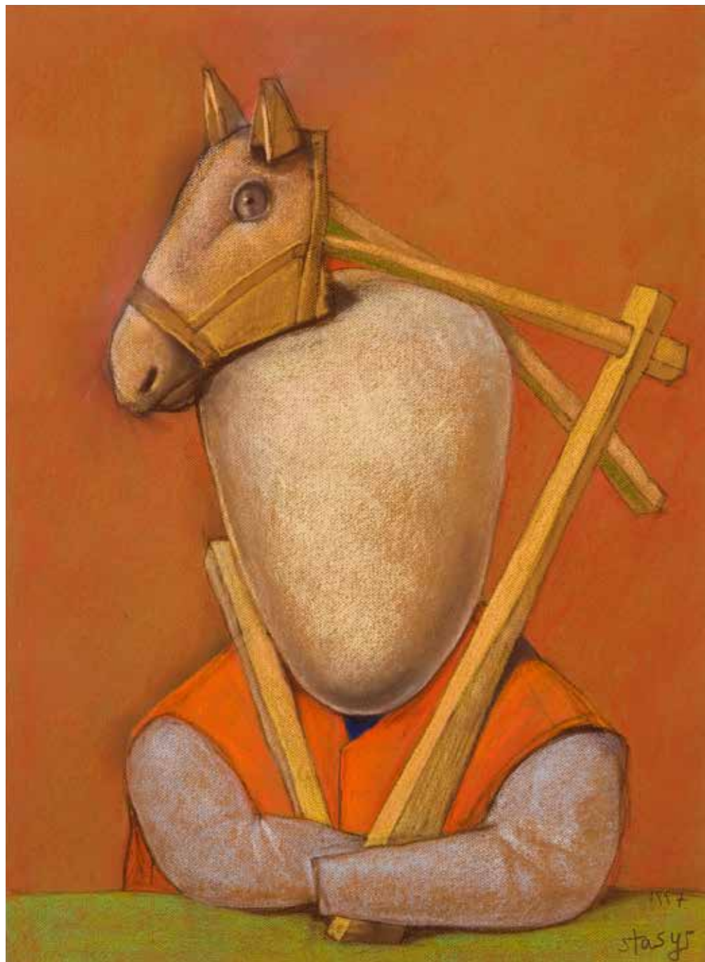
Horse on the Head - Cheval sur la tête