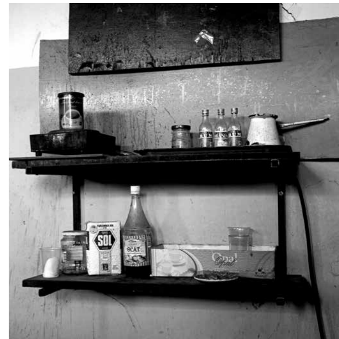
Damir Matijević- Segestica