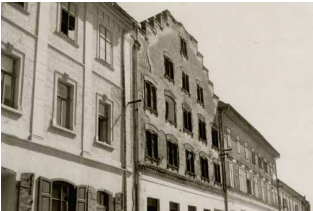
Old grain warehouse - Dutch House (Holandska kuća)