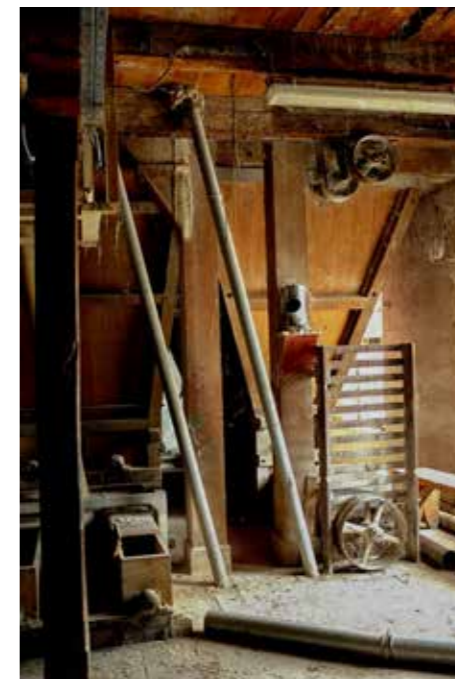
Stanko Abadžić-Old mill