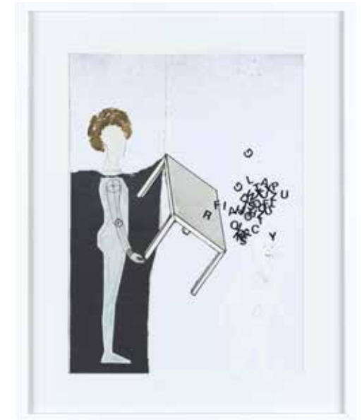
Letters, 2017 Artothek des Bundes, Photo/Foto: Johannes Stoll, © Belvedere, Vienna/ Wien