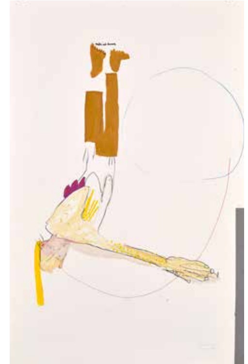
Der Feigheit ihre Kunst, der Kunst ihre Feigheit (To cowardice its art, to art its cowardice), 2013 Artothek des Bundes