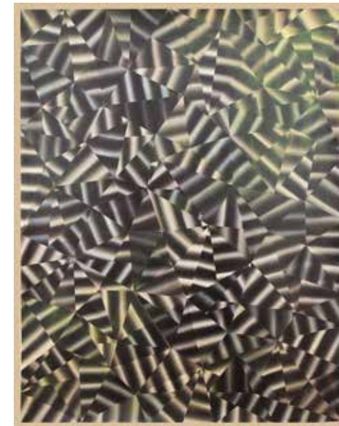
Ohne Titel (Untitled), 2012 Artothek des Bundes, Photo/Foto: Maureen Kaegi; © Bildrecht, Vienna/Wien, 2018