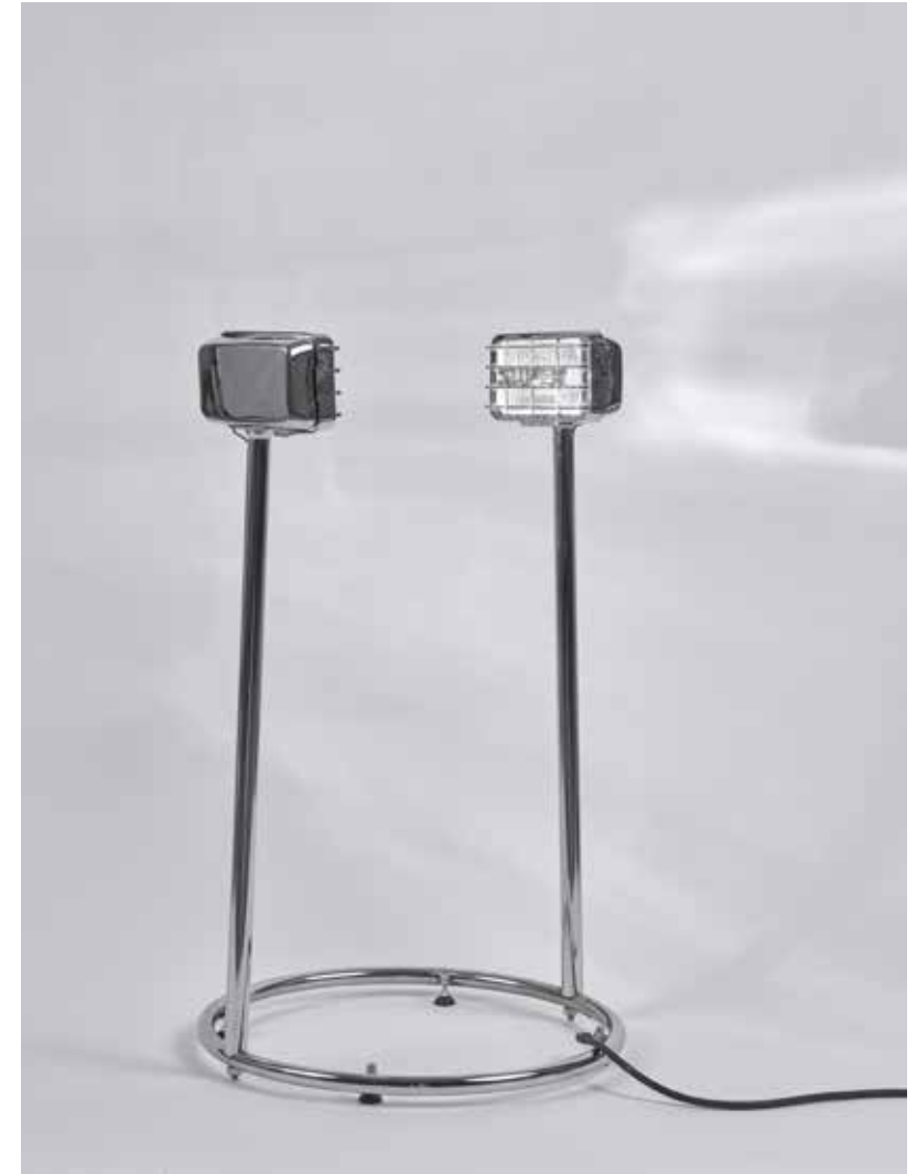
SUPER-SUPER, 2014 Artothek des Bundes