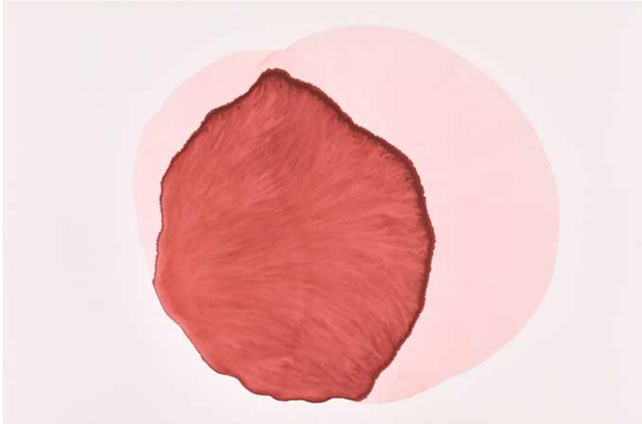
Aquarell (Watercolour) (réf. 82), 2012 Artothek des Bundes, Photo/Foto: Johannes Stoll, © Belvedere, Vienna/

Gabriele Chiari , 1978 geboren, Studium an der École nationale supérieure des Beaux Arts in Paris, lebt und arbeitet in Paris.