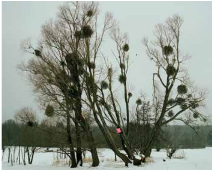
Parasit #1 (Parasite #1), 2013 Artothek des Bundes