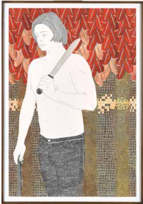
ogun/ada, 2015 Artothek des Bundes