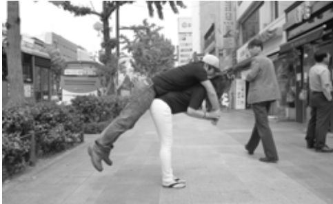
Anatomie der Verbeugung (Anatomy of the Bow), 2012 Artothek des Bundes