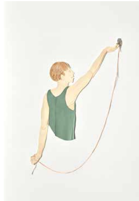
Ich lass Dir Deine Freiheit II (I give you your freedom II), 2013 Artothek des Bundes