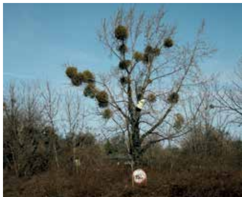
Parasit #2 (Parasite #2), 2013 Artothek des Bundes