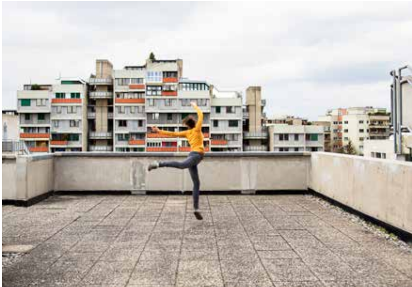
Public Exercise, 2014 Artothek des Bundes