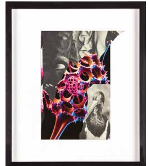
Ohne Titel (Untitled) (WVZ 326), 2014 Artothek des Bundes