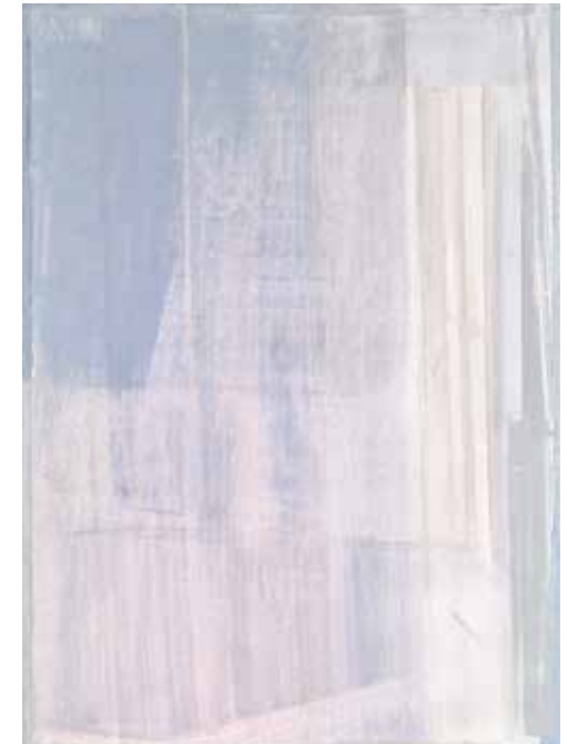
Raumort (Space place), 2012/2013 Artothek des Bundes