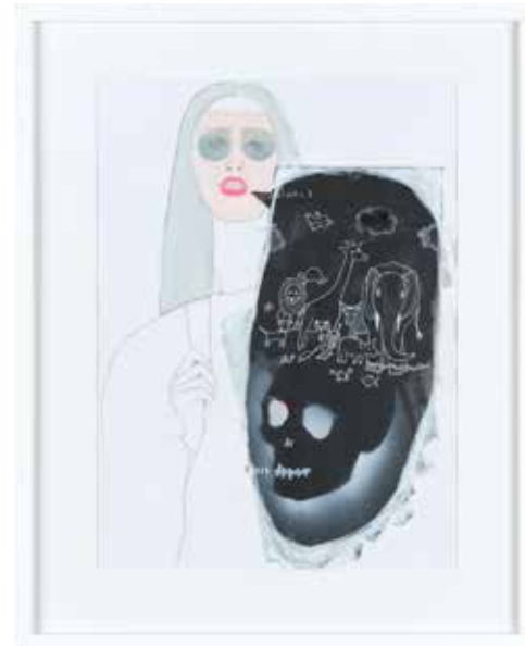
Animals first, 2017 Artothek des Bundes