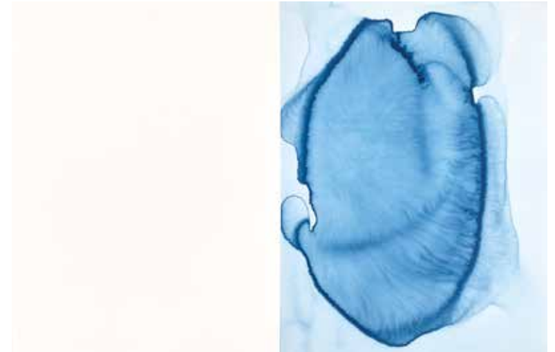
Aquarell (Watercolour) (réf. 83), 2012 Artothek des Bundes