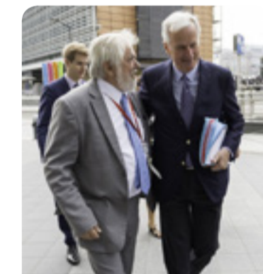
Michel Barnier , EU:s chefsförhandlare för brexit, tillsammans med EESK:s ordförande Georges Dassis

Alla var överens om att brexit är en viktig fråga och att det är av intresse både för EU-27 och Storbritannien att nå en god överenskommelse, men att det viktigaste när allt kommer omkring är Europas framtid. "Vi måste göra människor medvetna om EU-medlemskapets många fördelar. Brexit har mycket tydligt visat att många människor inte är införstådda med att