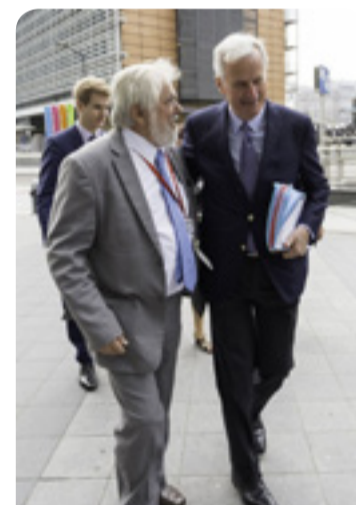
Michel Barnier , EU-hoofdonderhandelaar voor de brexit, met Georges Dassis , voorzitter van het EESC

Allen waren het erover eens dat hoewel de Brexit belangrijk is en zowel de EU-27 als het Verenigd Koninkrijk belang hebben bij een goede deal, de toekomst van Europa voorop dient te staan. "We moeten mensen bewust maken van de ontelbare voordelen van het lidmaatschap van de EU. De Brexit heeft duidelijk aangetoond dat veel mensen zich niet realiseren dat deze voordelen voortvloeien uit het lidmaatschap van de EU. In het Verenigd Koninkrijk beginnen veel mensen dit nu pas