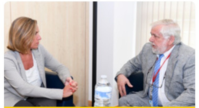
Federica Mogherini u George Dassis matul il-Granet tas-Sočjetà Ċivili

Fis-26 u s-27 ta' Ġunju, il-KESE ospita l-edizzjoni tal-2017 tal-Granet tas-Sočjetà Ċivili. Dan ir-raggruppament fuq skala wiesgħa tal-Organizzazzjonijiet tas-Sočjetà Ċivili (OSĊ) minn madwar l-Ewropa pprova kontribut qawwi min-naħa tas-soċjetà ċivili għad-dibattitu li tnedja mill-Kummissjoni permezz tal-White Paper tagħha dwar il-Ġejjieni tal-Ewropa . Sar appell qawwi għal impetu politiku għid biex l-UE titnedja mill-għid fuq il-bażi tal-valuri fundamentali tagħna u wkoll biex jiġi espress impenn ċar mill-OSĊ biex timxi 'l quddiem f'dan il-qasam. Għadd ta' talbiet ewlenin u impenji mis-soċjetà ċivili (ara http://bit.ly/2vWVffv ) ġew adottati u tressqu quddiem l-istituzzjonijiet tal-UE responsabbli għat-teħid tad-deċiżjonijiet dwar erba' temi diffiċli: il-populizmu, ir-rivoluzzjoni teknoloġika u l-impatt tagħha fuq ix-xogħol u d-demokrazija, it-tisħiħ tal-pożizzjoni tal-organizzazzjonijiet tas-soċjetà ċivili, u l-koeżjoni soċjali u territorjali.