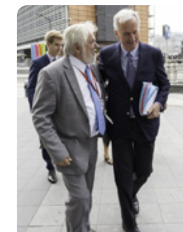
Michel Barnier , Negozjatur Ewlieni tal-UE għall-Brexit, mal-President tal-KESE Georges Dassis

Kulhadd qabel li, għalkemm il-Brexit hija importanti u li huwa fl-interess tal-UE27 u tar-Renju Unit li jintlaħaq ftehim tajjeb, l-iktar haġa importanti hija l-gejjieni tal-Ewropa. "Irriđu nagħmlu n-nies konxji tal-vantaġġi bla limitu ta' shubija fl-UE. Il-Brexit uriet b'mod ċar li hafna persuni mħumex konxji mill-fatt li dawn il-vantaġġi jiġu minn shubija mal-UE. Fir-Renju Unit, bosta persuni qed jibdeu