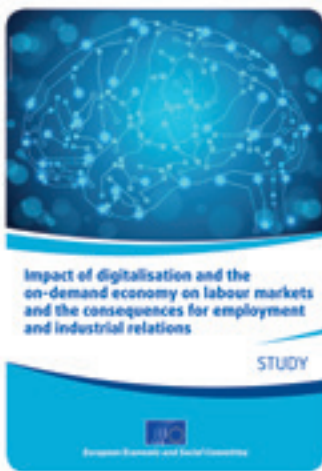
miċ-Ċentru għall-Istudji Politici Ewropej (CEPS). Id-dokument jista' jtnizzel permezz ta' din il-link. (lj)

L-istudju thejja għall-Kumitat Ekonomiku u Soċjali Ewropew fuq talba tal-Grupp ta' Min Ihaddem minn tim ta' riċerka