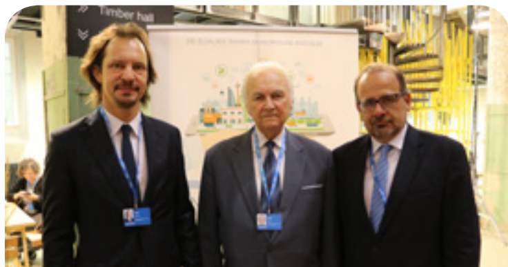
Indrek Saar (Estijos kultūros ministras), Arnold Rüütel (buvęs Estijos prezidentas), Luca Jahier (EESRK įvairių interesų grupės pirmininkas)

Renginyje dalyvavo daugiau kaip 100 vietos pilietinės visuomenės suinteresuotųjų subjektų ir ekspertų. Konferenciją pradėjo