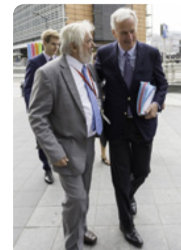
Michel Barnier , negociador principal de la UE para el brexit , con Georges Dassis , presidente del CESE

Todos manifestaron estar de acuerdo en que, aunque el brexit es importante y asegurar un buen acuerdo redundará en interés de la EU-27 y el Reino Unido, lo más importante es el futuro de Europa. «Tenemos que concienciar a los ciudadanos de las innumerables ventajas que reporta su pertenencia a la UE. El brexit ha puesto de manifiesto muy claramente que muchos ciudadanos no son conscientes de que estas ventajas se deben a ser miembros de la UE. En el Reino Unido, muchos ciudadanos están empezando a cobrar conciencia de este hecho. Ahora corresponde a las partes interesadas europeas hacer que la EU-27 sea más fuerte y cohesionada. El CESE está