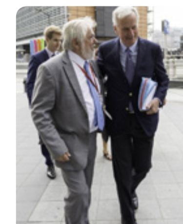
Michel Barnier , hlavní vyjednávač EU pro brexit, s předsedou EHSV Georgesem Dassisem

Všichni se shodli na tom, že i když je brexit důležitý a zajištění dobré dohody je v zájmu EU-27 i Spojeného království, nejdůležitější otázkou je budoucnost Evropy. „Musíme zajistit, aby si lidé uvědomili nesčetné výhody plynoucí