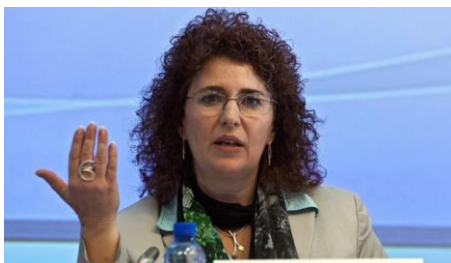
Christa Schweng, presidente dell'Osservatorio del mercato del lavoro e relatrice dello studio

A questo proposito, l'Osservatorio del mercato del lavoro del Comitato economico e sociale europeo ha condotto questo studio sull'attuazione delle politiche dell'UE a favore dell'occupazione giovanile in sei Stati membri ( Grecia, Croazia, Italia, Austria, Slovacchia e Finlandia ), dal punto di vista della società civile. Lo studio ha coinvolto numerosi rappresentanti della società civile, organizzazioni giovanili e autorità pubbliche, che ringraziamo sentitamente per l'impegno e la collaborazione.