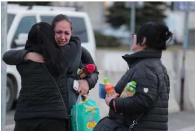
S?AWEK KAMINSKI / GW