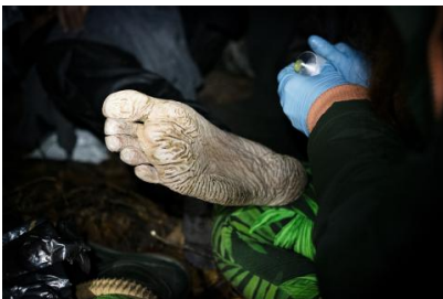
Photo from 'The Jungle' project: Trench foot, a fungal infection that affects the feet, is one of the most common health problems among refugees attempting to cross the Bia'owie'a Forest (October 2022).

Il-KESE diġà adotta Opinjonijiet ewlenin dwar temi ewlenin relatati mal-migrazzjoni u l-ażil, inkluż dwar il-ħolqien tal- Patt dwar il-Migrazzjoni u l-Ażil , dwar ir- Regolament dwar l-ażil u l-migrazzjoni , dwar il- pakkett dwar l-Unjoni tas-Sigurtà/il-pakkett Schengen , u dwar il- Pjan ta' Azzjoni dwar l-integrazzjoni u l-inkluzjoni 2021-2027 . Fl-2009, il-KESE waqqaf ukoll Grupp Permanenti dwar l-Immigrazzjoni u l-Integrazzjoni , li jgħin biex jagħti forma tangibbli lir-rwol tal-KESE bħala faċilitatur bejn is-soċjetà ċivili u l-istituzzjonijiet tal-UE dwar kwistjonijiet ta' migrazzjoni, kif ukoll jistinka biex jippromovi l-iżvilupp ta' politika Ewropea komuni dwar l-immigrazzjoni u l-integrazzjoni. (Im)