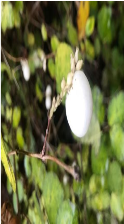
A sky of hope