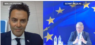
Meeting of EESC Employers' Group with Commissioner Schmit 15 April 2021