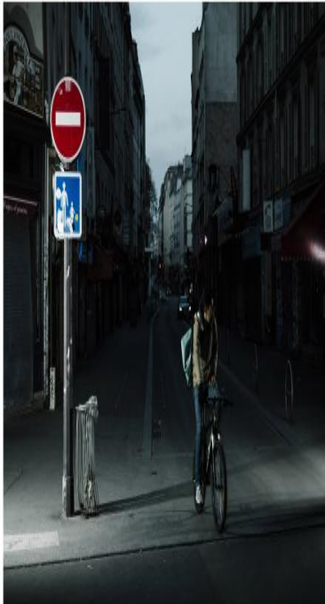
LES COWBOYS MODERNES

EØSU er vært for en virtual fotoudstilling af den franske fotograf Frédéric Stucin, der sætter fokus på madudbringere som et karakteristisk træk ved det moderne byliv og en ny form for beskæftigelse, der ofte tilsidesætter de europæiske regler for sikkerhed og sundhed for arbejdstagere.