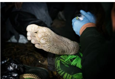
Photo from 'The Jungle' project: Trench foot, a fungal infection that affects the feet, is one of the most common health problems among refugees attempting to cross the Bia?owie?a Forest (October 2022).

EØSU har allerede vedtaget vigtige udtalelser om vigtige emner vedrørende migration og asyl, herunder om udformningen af pagten om migration og asyl , om forordningen om asylforvaltning og migrationsstyring , om pakken om sikkerhedsunionen/Schengen-pakken og om handlingsplanen om integration og inklusion 2021-2027 . EØSU nedsatte også i 2009 en permanent gruppe om indvandring og integration , som bidrager til at konkretisere EØSU's rolle som formidler mellem civilsamfundet og EU-institutionerne i migrationsspørgsmål, samtidig med at det bestræber sig på at fremme udviklingen af en fælles europæisk indvandrings- og integrationspolitik. (Im)