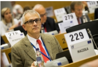
конкуренцията и иновациите“.

В становище по собствена инициатива, прието през октомври, Консултативната комисия по индустриални промени (CCMI) на Европейския икономически и социален комитет (ЕИСК) призова за приобщаващ секторен преход към цифровизиран железопътен сектор и предложи ръководена от Комисията инициатива да събере необходимите инвестиции от 100 милиарда евро.