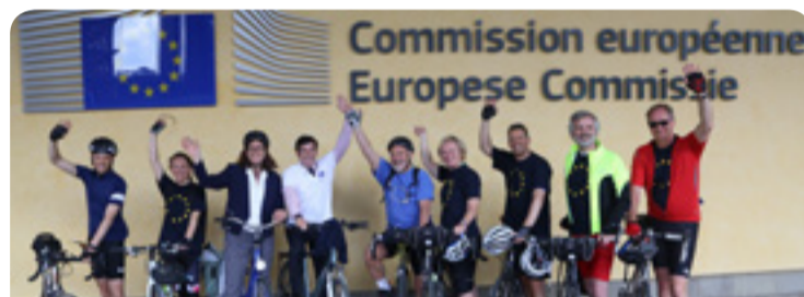
Kommissionsledamot Cecilia Malmström och EESK:s vice ordförande Gonçalo Lobo Xavier tillsammans med EU Green Bikers utanför Berlaymont-byggnaden

Utmärkelsen, som i år delades ut för första gången, understöds av kommissionen och genomförs av Finnova Foundation i samarbete med Startup Europe. Syftet är att hitta inspirerande exempel som kan bidra till att utveckla företagandet i Europa. Precis som en stor del av EESK:s arbete handlar det om att hitta hållbara tillväxtmodeller och investeringsstrategier för att skapa arbetstillfällen, samt om metoder för att göra EU till en resurseffektiv och konkurrenskraftig ekonomi. (mre) ●