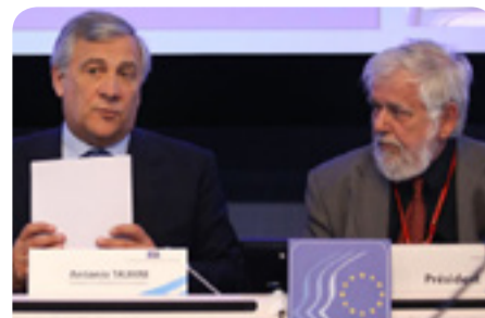
Predsednik EP Antonio Tajani in predsednik EESO Georges Dassis

Predsednik EP Antonio Tajani se je v četrtek, 1. junija, udeležil plenarnega zasedanja EESO, na katerem je spregovoril o prednostnih nalogah Parlamenta ter krepitvi sodelovanja med institucijama.